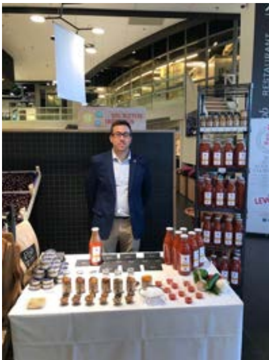
ROB The Gourmets Market (BELGICA)