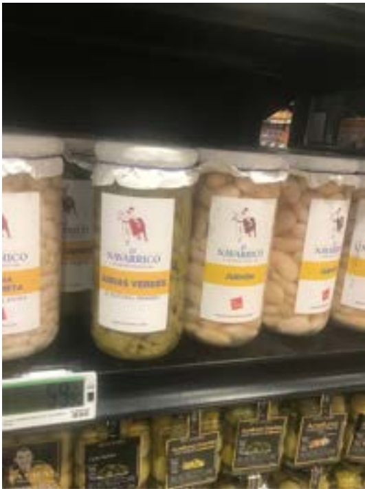
LA COMERCIAL (MEXICO)