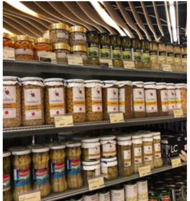
GREAT FOOD HALL (HONG KONG)